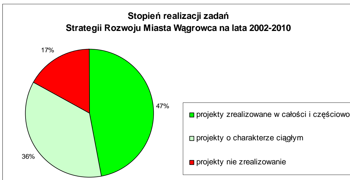
Wykres 2.1. Stopień realizacji zadań Strategii Rozwoju Miasta Wągrowca na lata 2002-2010

W ujęciu statystycznym stopień wykonania zadań, zapisanych w strategii z 2002 roku został przedstawiony na poniższym wykresie.